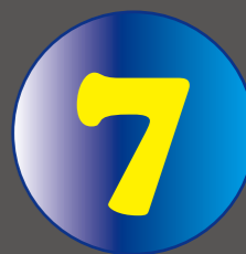
快捷的交货期， 7 个工作日