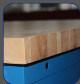
美国原材台面，更结实耐用