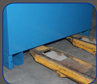
加高式脚铲，便于现场搬运