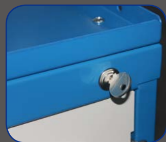
瑞士进口锁具，确保柜体安全