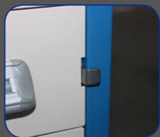
移动安全锁，确保货物安全