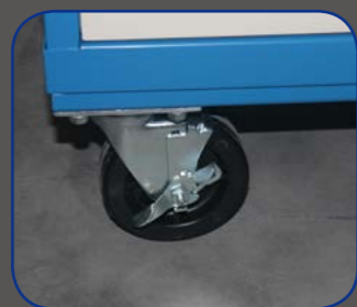
优质脚轮，确保重载荷使用