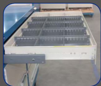
全开式抽屉，取货更便捷