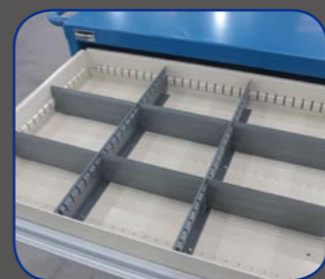
可调隔间，空间不浪费